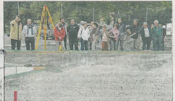
Des élus, membres d'associations, techniciens et habitants de La Javie ont assisté hier au dernier essai sur le modèle physique.