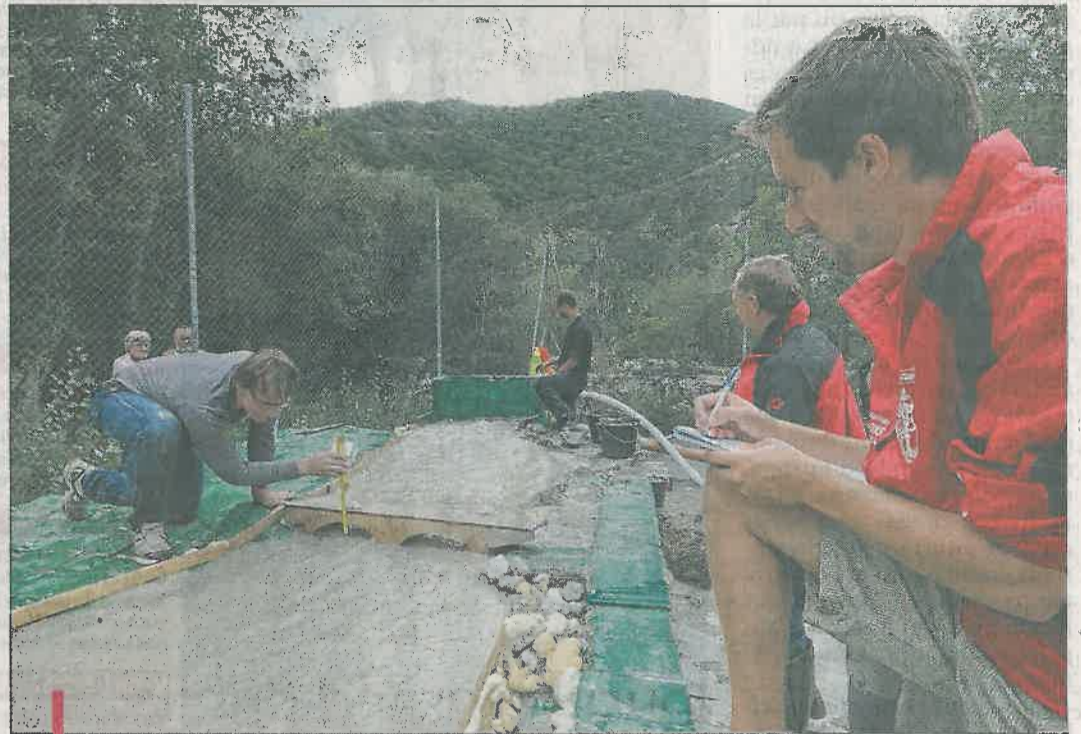
A partir des résultats de l'essai d'octobre 2011 sur la maquette au 1/40e, les ingénieurs en charge de l'étude, ont réalisé hier une seconde simulation de crues avec des digues rehaussées.

Pour arriver à cette conclusion, d'importants moyens ont été mis en œuvre, telle cette maquette du modèle physique, à l'échelle 1/40e de la confluence de l'Arigéol et de la Bléone installée sur le court de tennis près du camping. Doublée d'un modèle numérique, elle représente le plus fidèlement possible 1750 m cumulés de cours d'eau avec la hauteur du lit et des digues reproduites grâce à des relevés effectués le